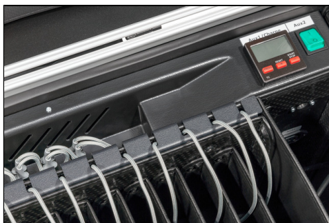
- inkl. Ladetimer